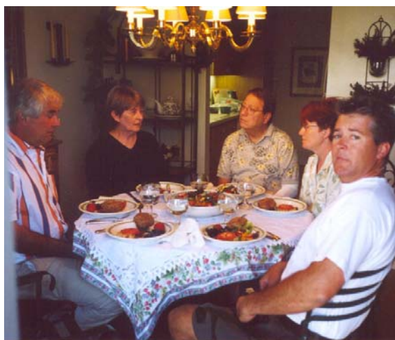
Salt Lake City.