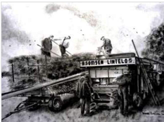
Tekening van Herman Peppelman over het dorsen in Lintelo.

In september was het tijd voor aardappelrooien. Het rooien gebeurde zowel met de hand als door een loonwerker met een aardappelrooier. Daarna raapten en sorteerden wij met z'n allen de gerooide aardappelen in aardappelmanden. De aardappelen werden bewaard in een grondkuil, afgedekt met een laag stro, blad en dennennaalden. 's Winters werd elke keer een mand vol aardappelen uit de kuil gehaald zowel voor ons gezin als de varkens. De voeraardappelen werden in de grote mantelpot in het bakhuis gekookt voor de varkens.