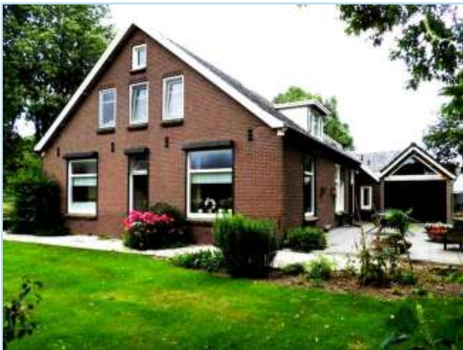
Boerderij 'De Snieder' tegenwoordig.

In het voorjaar werden ook nieuwe bomen geplant in de vorm van stekken, die uit rechte takken werden gehaald. Die werden in een rond gat in de grond geplant voor de volgende generatie populier of wilg. Naar behoefte werden ook oogstrijpe grove dennen en eiken uit ons eigen bos en houtsingels gekapt, voor zaaghout en afrasteringpalen.