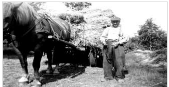
Garven op een oogstwagen

Aan het eind van de dag of aan het begin van de avond werden de garven aan hokken gezet, die in rijen op het stoppeland stonden om te drogen.