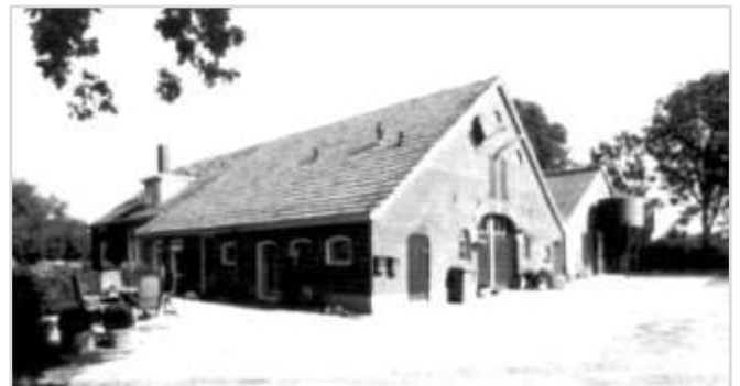
Boerderij de Snieder in Lintelo in 1996

In mijn boek Vrogger Thuus (2018, uitverkocht) beschrijf ik mijn jeugdherinneringen over het leven op boerderij 'De Snieder' in de Aaltense buurtschap Lintelo tussen 1950 en 1970. Het was de naoorlogse tijd in de beschermde omgeving van een traditioneel boerengezin, naoberschap en de gereformeerde zuil. Het boek beschrijft een tijds- en sfeerbeeld van wat achteraf een interessante overgangperiode was tussen het traditionele boerenleven van vroeger en het eind van de twintigste eeuw.