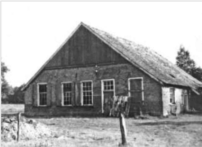
De Bark, de oude boerderij waarin de verzetsgroep huisde.

De relatieve stilte rond De Bark wordt zondag 26 februari 1945 verstoord. Drie Duitse militairen struinen rond en in de boerderij. Mogelijk zien ze spullen die wijzen op bewoning. De verzetsgroep vertrouwt het niet. Als de Duitsers vertrekken worden ze ingerekend door de verzetsmannen. Ze nemen ook een vierde Duitse soldaat gevangen die verderop bij zijn voertuig staat.