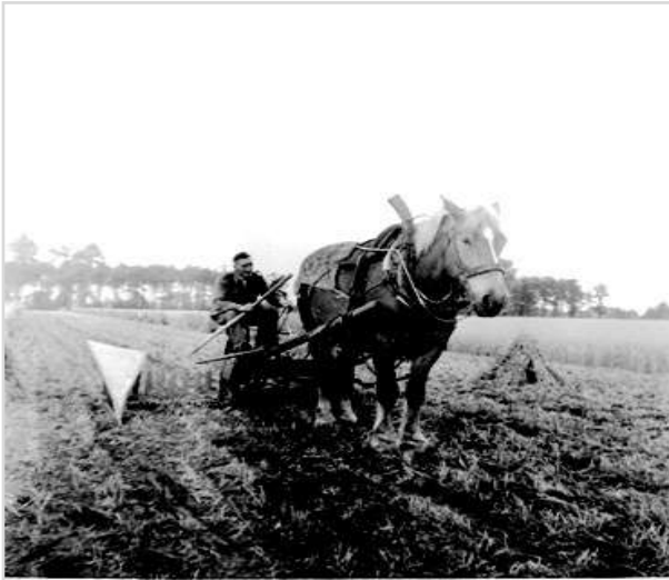
Rogge maaien met paard

De hooitijd was een heerlijke tijd. De natuur is op z'n mooist en alles bloeit.