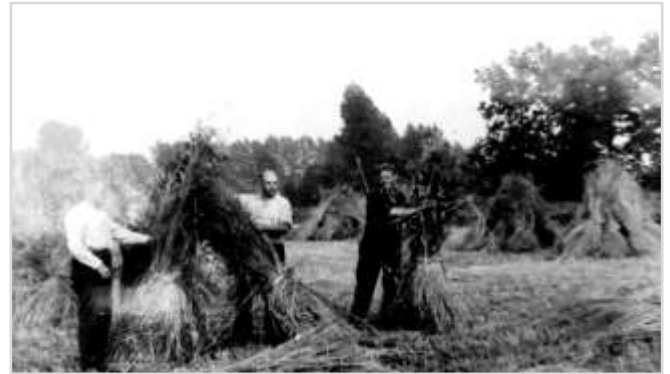
Rogge opzetten, met mijn vader in het midden samen met een buurman en zwager die meehelpten

Het werd nog eenvoudiger toen er hooibalen kwamen, die door een loonwerker werden met een balenpers