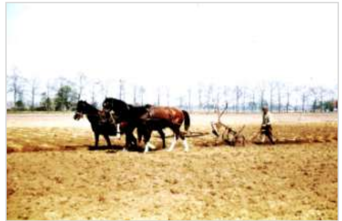
Het ploegen van de akkers

Een van de eerste voorjaarswerkzaamheden was het bemesten en ploegen van de akkers. De mest uit de potstal werd met een mestkar getrokken door het paard naar het land gebracht.