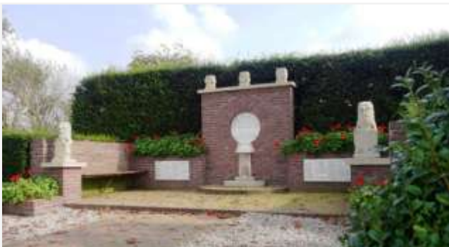
Het monument met de 46 namen op Rademakersbroek in Varsseveld