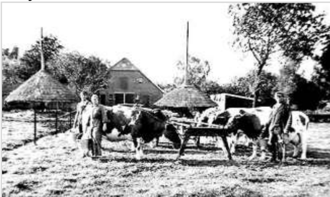
Melken in de wei