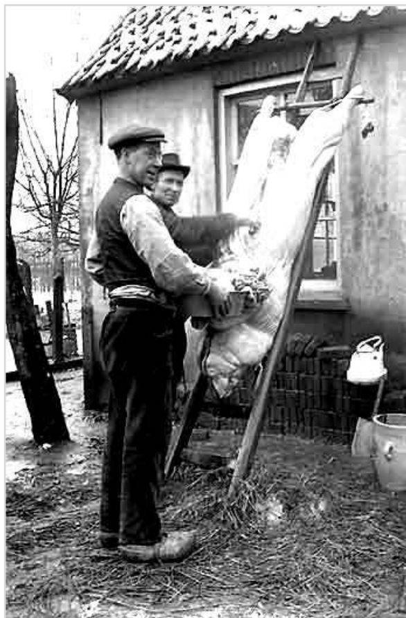
Varken op de ladder

November was de slachmaand en werd een varken geslacht voor eigen gebruik. Op de slachtdag kwam 's morgens de slachter bij ons thuis. Zodra het varken was geslacht was, werd het op een ladder gehangen om uit te wasemen en af te koelen. 's Middags kwam de slachter om het in stukken te verdelen, af te hakken. Op de slachtdag was het voor moeder en oma een drukte van belang. Er werden allerlei vleesproducten gemaakt als karbonade, metworst, leverworst, balkenbrij, zure zult en natuurlijk hammen die werden gedroogd.