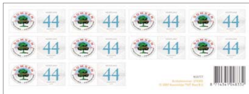
De Somsenstichting postzegels

De zegels worden verzonden nadat uw geld is overgemaakt op giro 79 09 885 t.n.v. Somsen Stichting Lichtenvoorde onder vermelding van het aantal postzegels. En vergeet niet uw naam en adres er bij te vermelden.